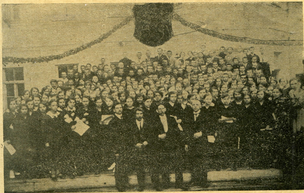
Panevėžio jungtinis choras 1924 m. dalyvavęs „Dainos Dienoje“