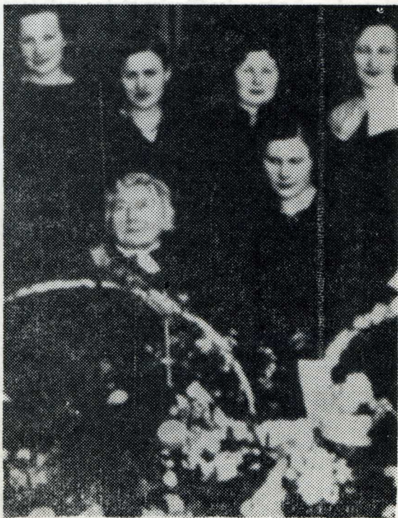
Panevėžietės sveikina rašytoją su 75-ju metinių jubiliejumi 1936 m. Virš jubiliatės — S. Nėris

1899 metais rašytoja su draugų būreliu pastato Palangoje pirmą lietuvišką vaidinimą — Keturakio komediją „Amerika pirtyje“. Tuos sunkumus spaudos draudimo metais, tekusius jiems nugalėti, aprašo atsiminimų knygoje „Iš mūsų vargų ir kovų“.