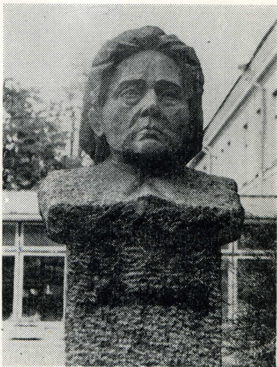
Paminklas rašytojai Panevėžyje.