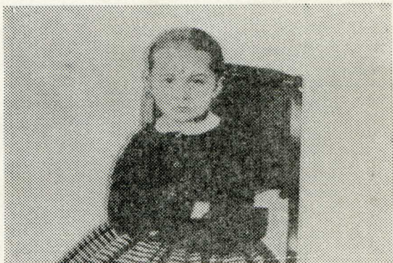
Gabrielė Petkevičaitė 1867 m.