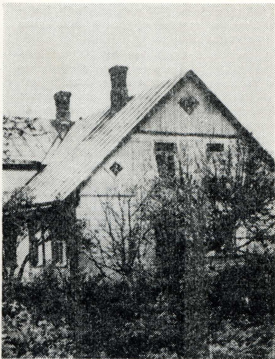
Paskutinė rašytojos gyvenamoji vieta.

Dabar memorialinis muziejus. P. Cvirkos g-jė Nr. 18