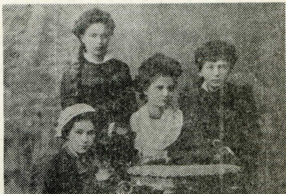
Būsimoji rašytoja su draugėmis apie 1874 m. stovi pirma iš dešinės.