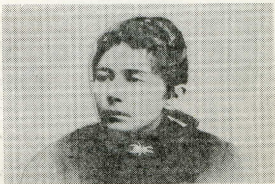
Gabrielė Petkevičaitė pradėjusi bendradarbiauti spaudoje 1890 m.