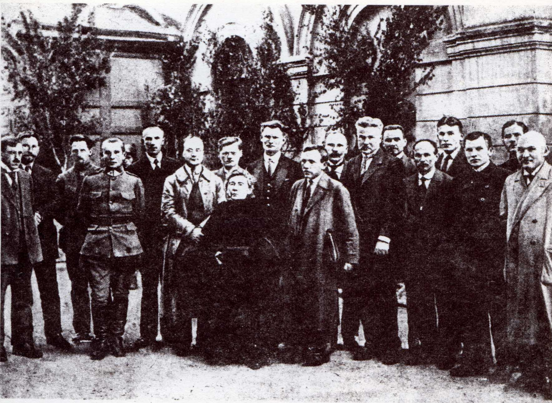
Socialistų Liaudininkų Demokratų ir Valstiečių S-gos Frakcijų Bloko nariai

4 auks 1 auks. p. direkt. tarnam auks. auks. nelikrų žydų vakarui ovisinų pus mang kavos puzų