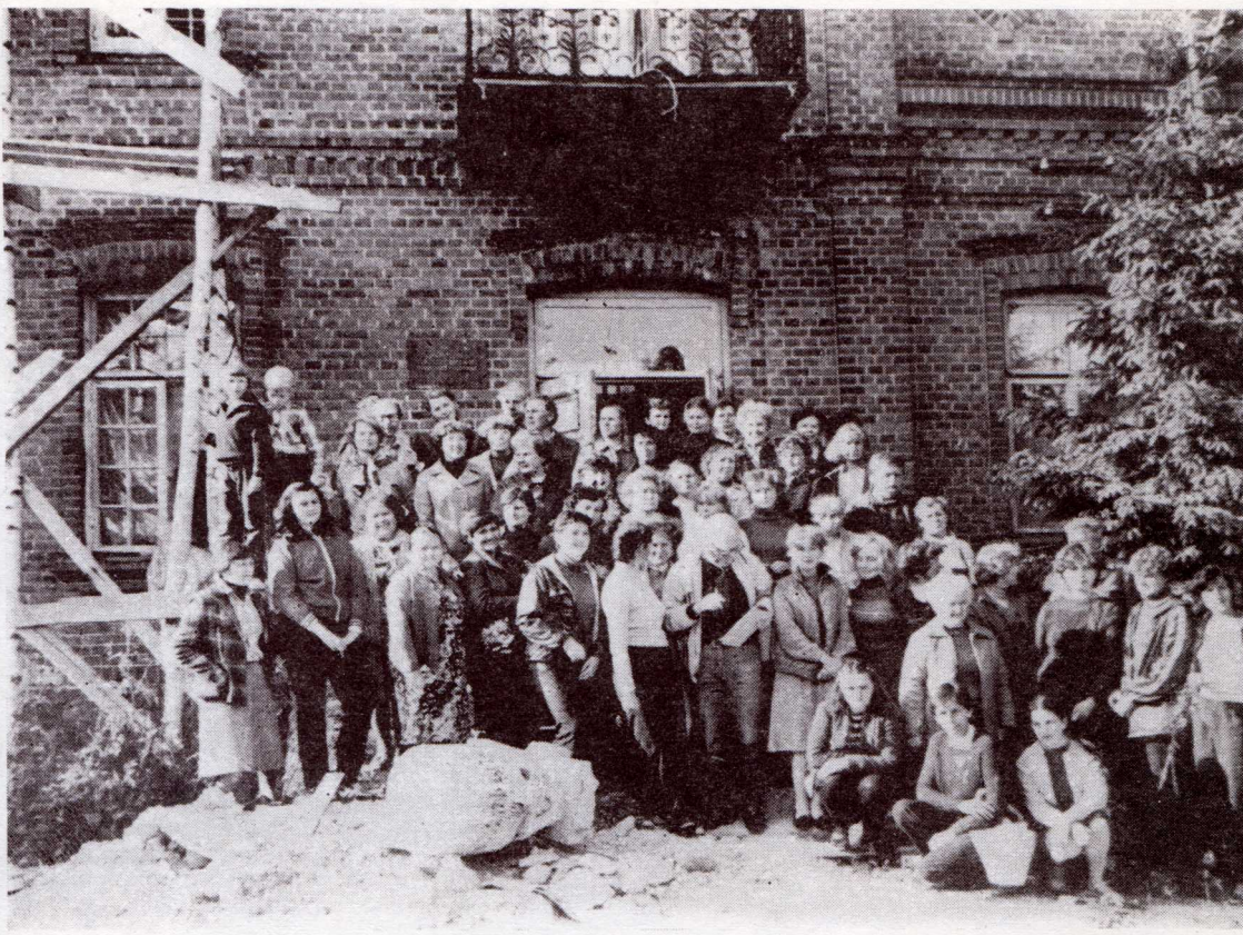
Panevėžio miesto Knygos bičiulių pirmoji talka Puziniškyje, 1985 m.

Labai dėkui iš Katalikų knygos ne išsitraukusi šviesiai paraišyti Jaman, gerčiau iš tėvo knygos irgi man draudžiamą